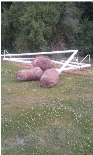
Die alten Tore