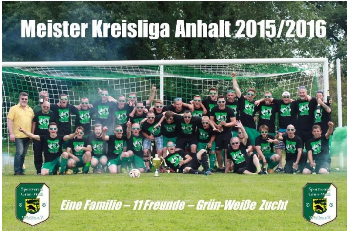
Meister/Herbstmeister Kreisliga Anhalt – Aufstieg Kreisoberliga 2015/2016