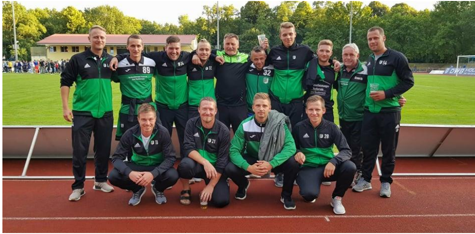
Trainerteam ab Juli 2018

Trainingslager Neuruppin 2018 – Hertha BSC vs. MSV Neuruppin