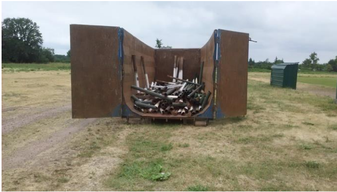
Alte Barrieren und Schneisen für Kabel bzw. Wasserleitung

Im Jahr 2018/2019 durften wir uns über eine Rele Förderung in Höhe von ca. 106.000 Euro, sowie eine Sparkassenförderung in Höhe von 4.500 Euro freuen, welche wir in neue Barrieren, eine neue Flutlichtanlage, eine automatische Beregnungsanlage und in neue Spielerkabinen investierten. Dabei leisteten wir einen großen Teil an Eigenleistung und steuerten zudem ca. 20.000 Euro der Gesamtsumme aus dem Verein bei. Außerdem renovierten wir die Fassade des Sportlerheims komplett aus Eigenmitteln.