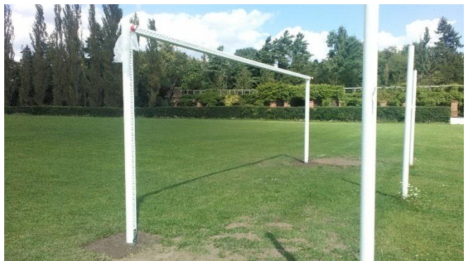
Bundesliga Tore der neuesten Generation

SV Grün-Weiß Wörlitz e.V. Abteilung Fußball Neuer Wall 111 06785 Oranienbaum-Wörlitz OT Wörlitz