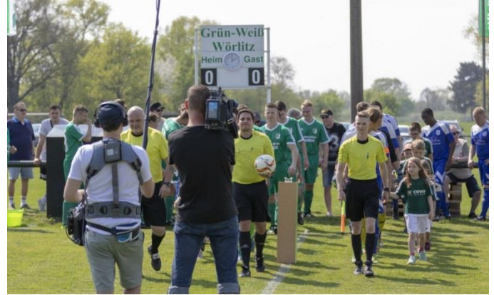
MDR „Mach dich ran“