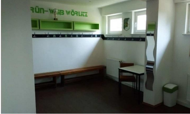
Kabine Männer (inkl. eigenem Sitzplatz für jedem mit Bild)