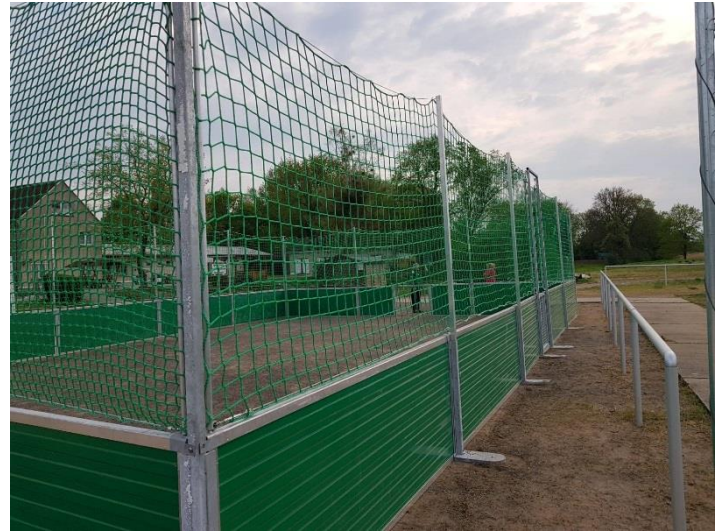
Kaufland Sponsoring sowie Sponsorentafel